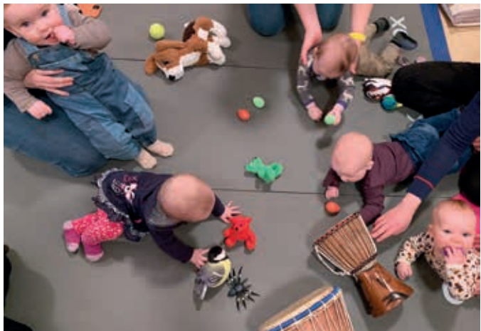
Moro for store og små på småbarnskafe.