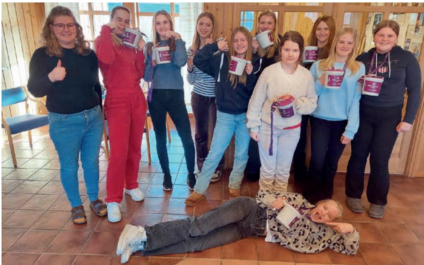
Gira gjeng som deltok på fasteaksjonen som bøssebærere.